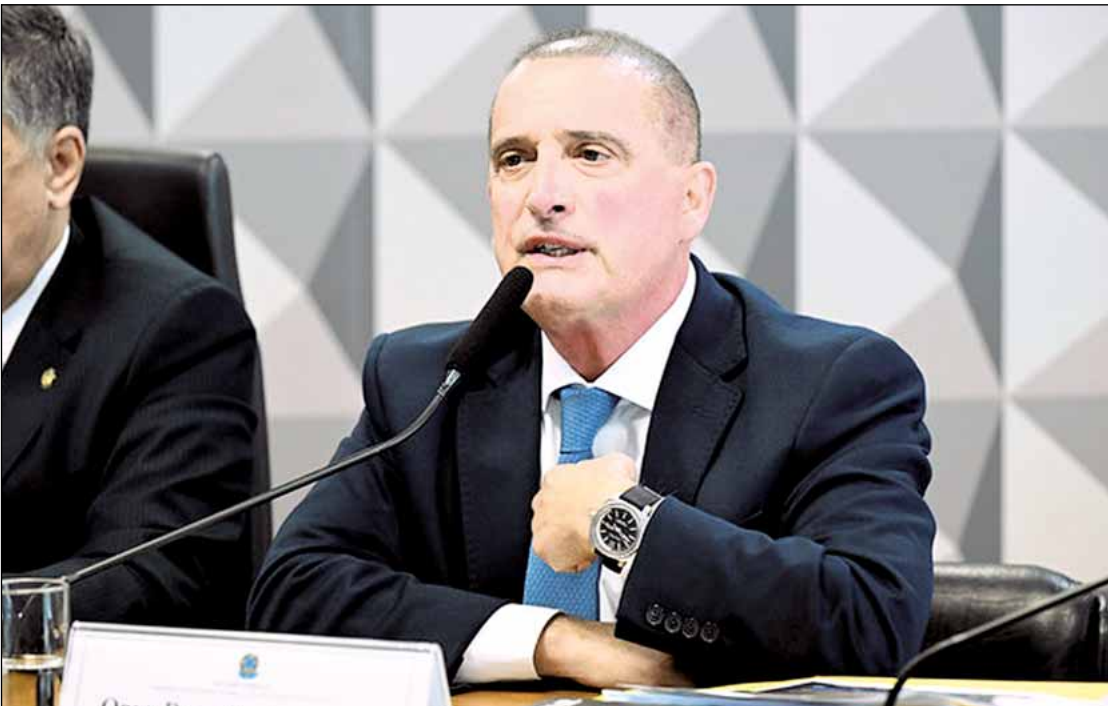
Ex-ministro no governo Bolsonaro, Onyx negou conhecer principais investigados na fraude

balho, onde ficou oito meses. E negou qualquer participação na farra do INSS. Logo em seguida, respondeu aos questionamentos dos parlamentares.